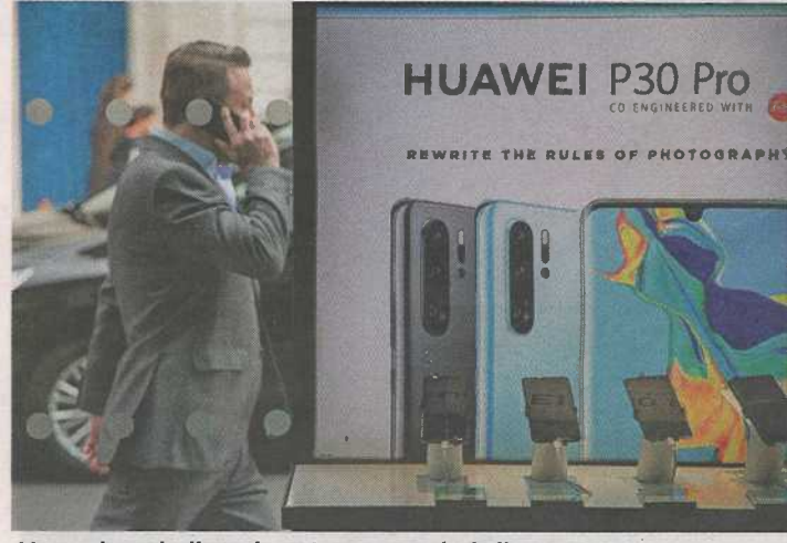
Huawein puhelinmainos Lontoossa huhtikuussa 2019.

Kaikissa käytössä olevissa standardoiduissa matkapuhelintekniikoissa on sisäänrakennettu